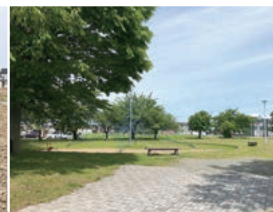
ふじまき児童公園 徒歩1分