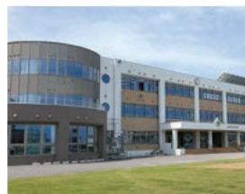
中央小学校 徒歩5分