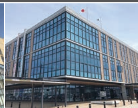
五所川原市役所 車5分