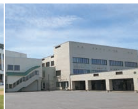
第一中学校 徒歩3分