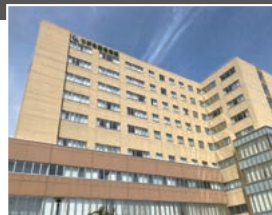
つがる総合病院 車8分